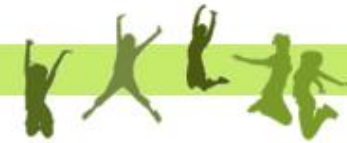
Schéma de Cohérence Territoriale - Rapport de Présentation - Volet 7 - Modalités de suivi -