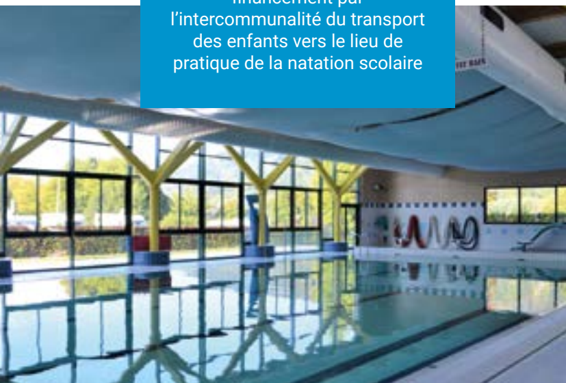
Piscine communautaire André Martin - Montville

> pour assurer à tous les usagers de pratiquer sous la surveillance de personnels qualifiés, dans un contexte national de tension sur ces emplois (il manque 5 000 maîtres nageurs sauveteurs dans les piscines publiques françaises).